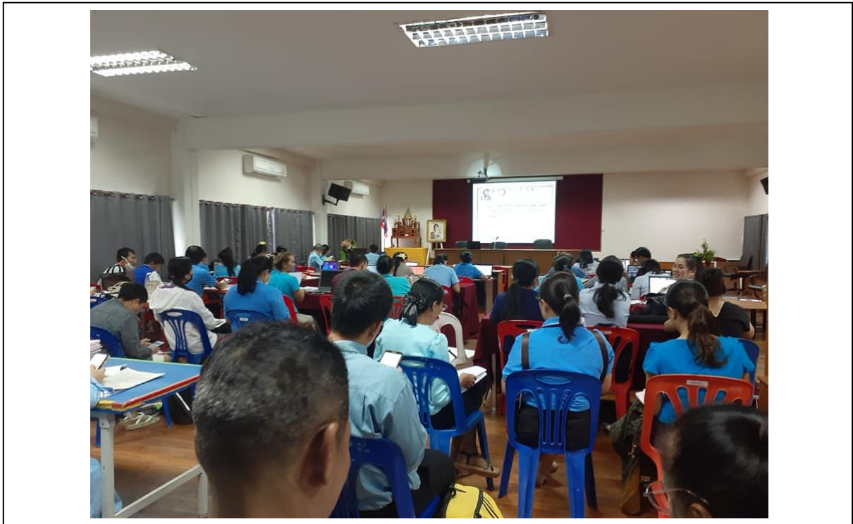
คณะครูทุกท่านเข้าร่วมประชุม ประเมิน ITT